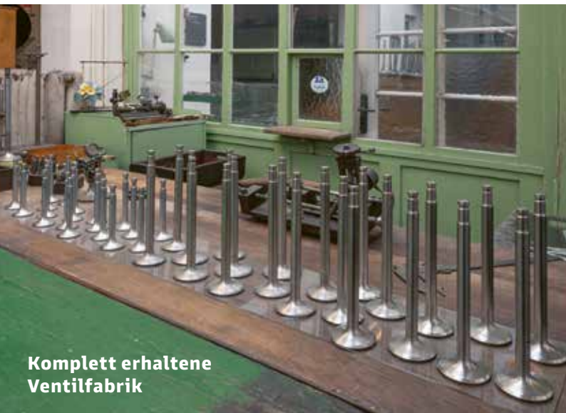
Komplett erhaltene Ventilfabrik