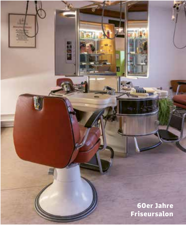
60er Jahre Friseursalon