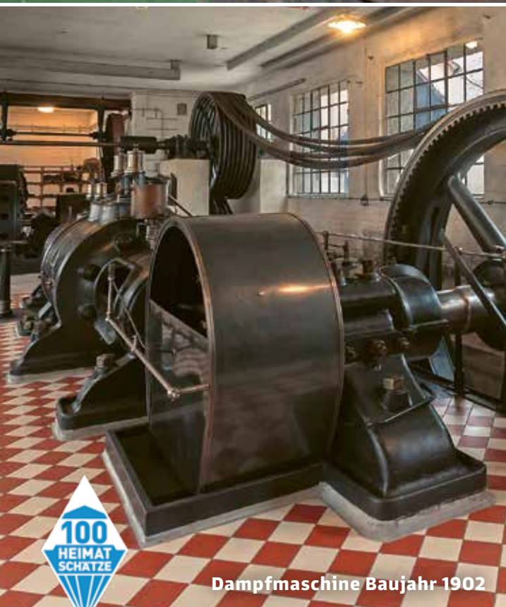
Dampfmaschine Baujahr 1902