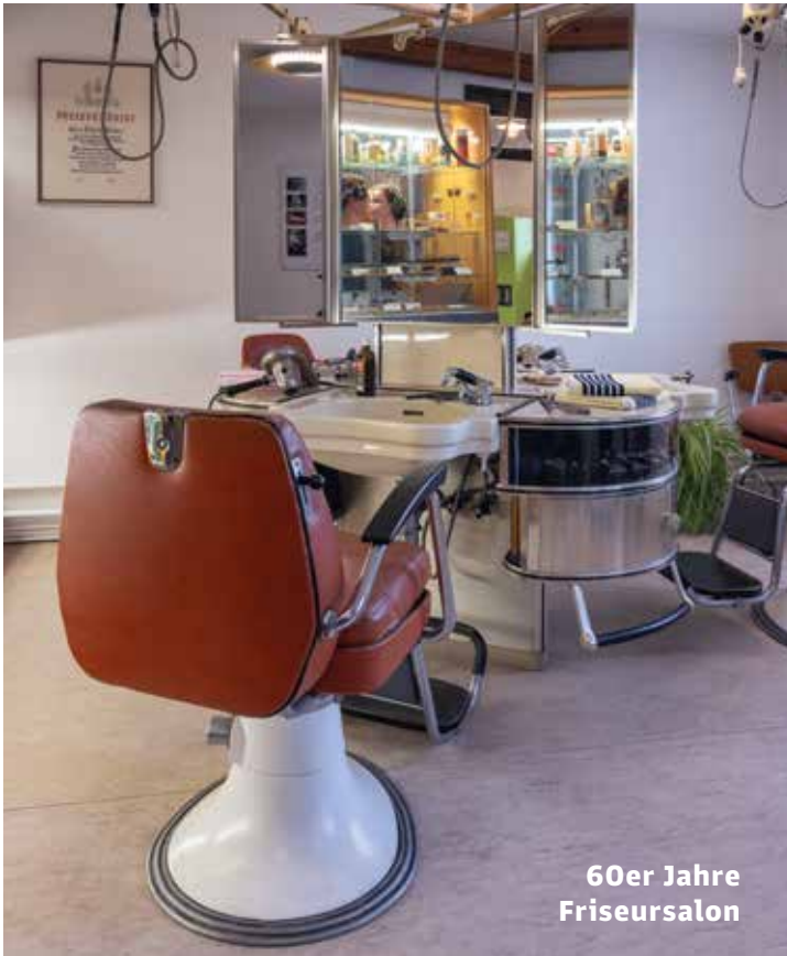
60er Jahre Friseursalon