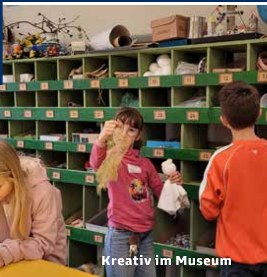
Kreativ im Museum