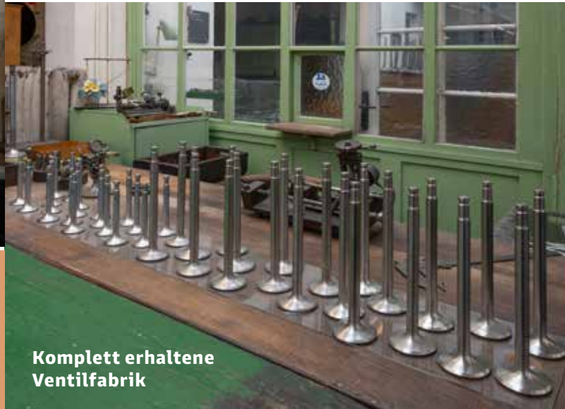
Komplett erhaltene Ventilfabrik