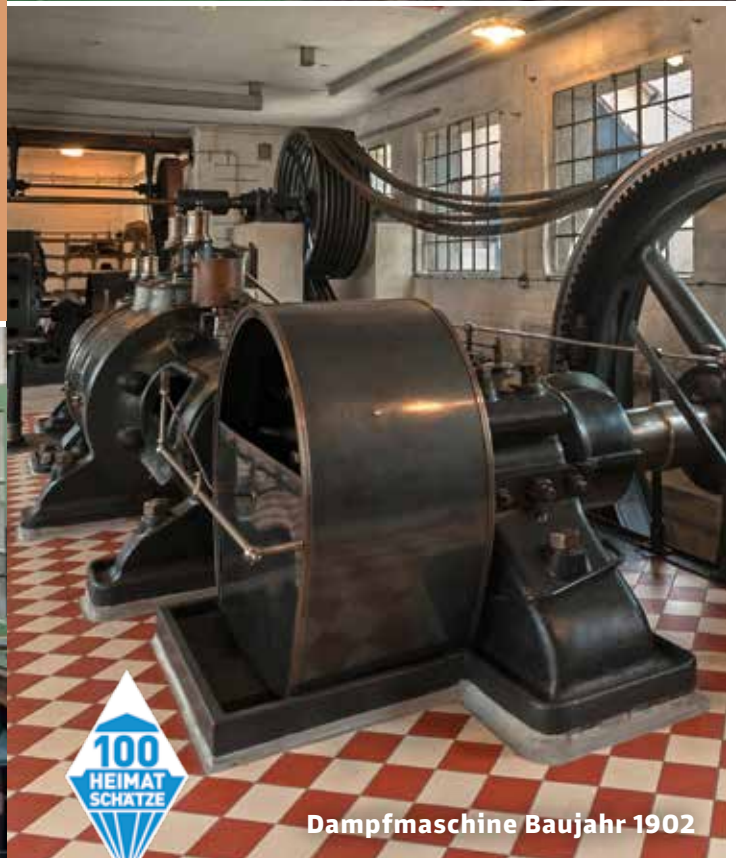
Dampfmaschine Baujahr 1902